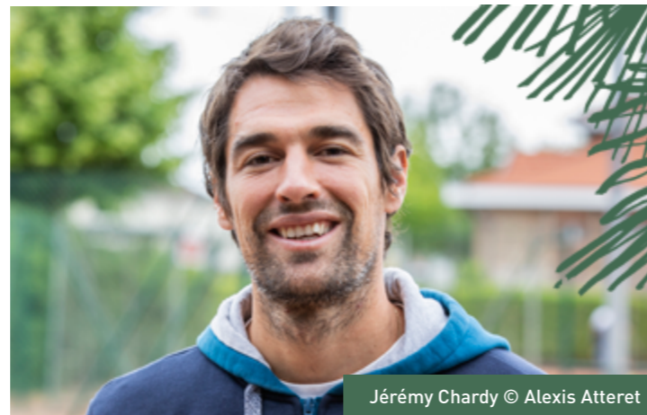
Jérémy Chardy

Trois fois champions avec ce club ce n'est vraiment pas rien ! Nous sommes très contents d'avoir gagné pour l'anniversaire de la Villa Primrose. J'adorais jouer les matchs par équipes en étant petit, aujourd'hui, ces matchs sont certes moins importants pour ma carrière, mais au niveau personnel, ce sont des moments que j'adore partager avec les gars et le staff, où l'on rigole beaucoup pendant deux semaines et demi. Nous sommes fiers d'apporter le titre pour les personnes qui travaillent au club.