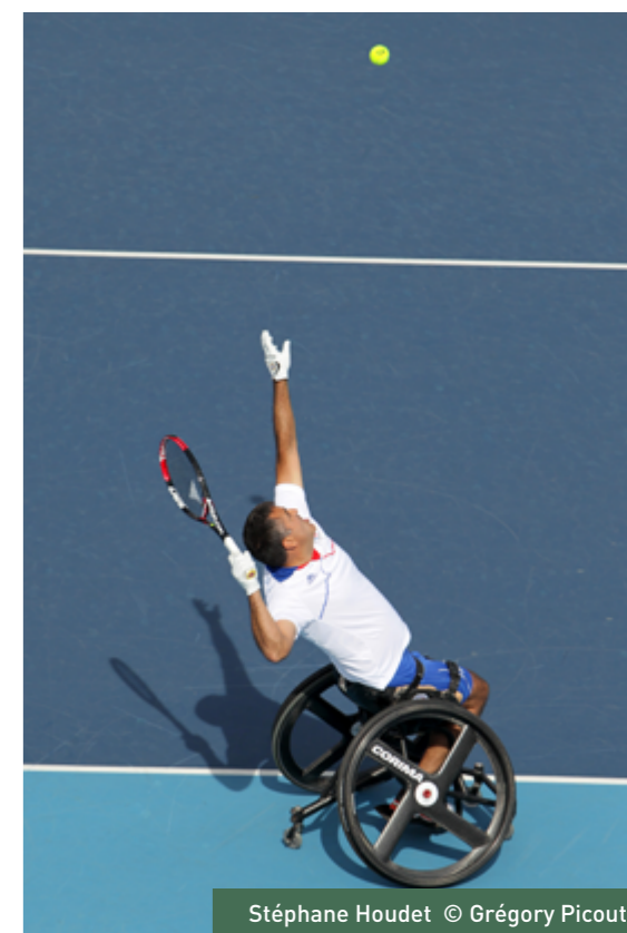
Stéphane Houdet

Alors que la journée touche à sa fin pour les joueurs du Tournoi, c'est l'occasion pour vous de participer à l'Afterwork animé ce soir par FIP Radio à partir de 19h. Discussions sur les résultats du jour ou sur les pronostics des prochaines journées, autant de sujets que vous pourrez aborder dans l'espace "Tie Break", où restauration et buvette sont de la partie.