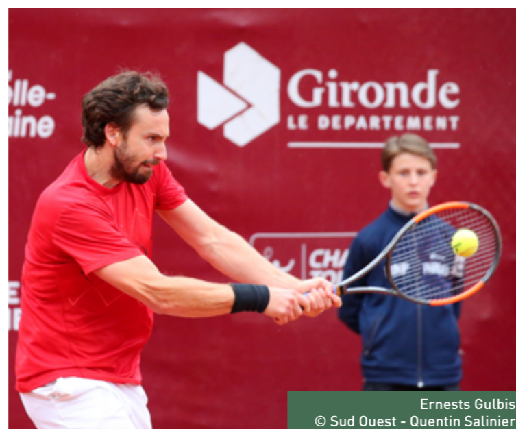
Ernests Gulbis

En ce qui concerne le début du Tournoi en double, Thanasi Kokkinakis et Carlos Berlocq se sont imposés pour leur entrée dans le Tournoi (7/5 - 6/4).