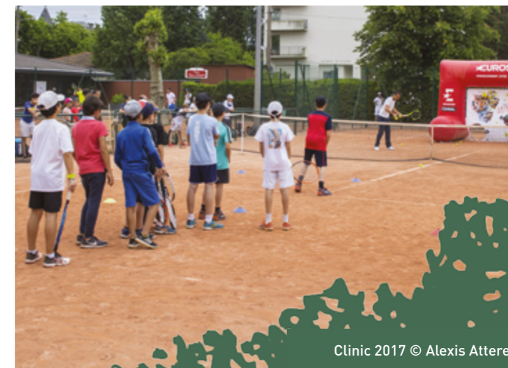
Clinic 2017

C'est désormais un rendez-vous quotidien, l'Afterwork vous attend à partir de 19h dans l'espace "Tie Break", où vous pourrez vous restaurer ou boire un verre tout en regardant la finale de l'Europa League !