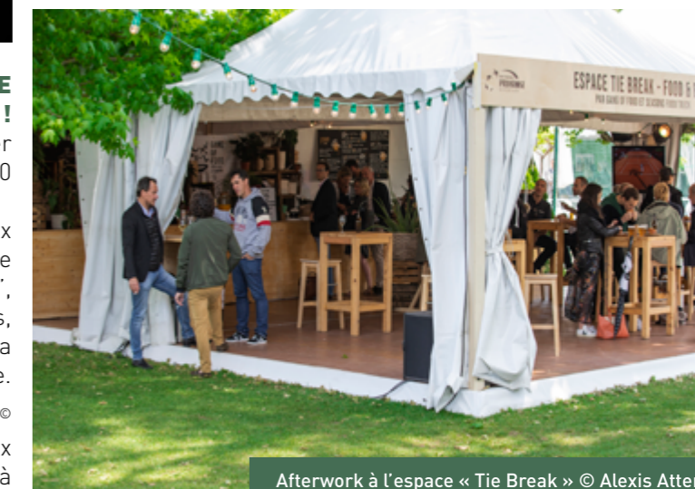
Afterwork à l'espace « Tie Break »

Le rituel est maintenant installé dans cette 11 e édition du Tournoi BNP Paribas Primrose. À mesure que le soleil se couche, il vous est possible de passer un dernier moment à la Villa Primrose au sein de l'espace « Tie Break » à partir de 19h. Les DJ's sont mis à l'honneur en ce jeudi soir avec FIFIB DJ et PENDENTIF DJ qui assureront une soirée musicale endiablée !