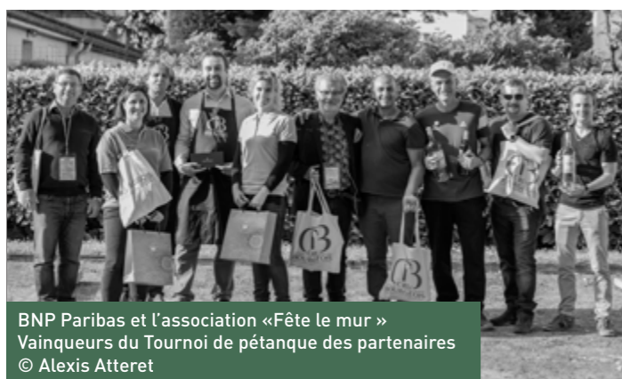
BNP Paribas et l'association «Fête le mur» Vainqueurs du Tournoi de pétanque des partenaires