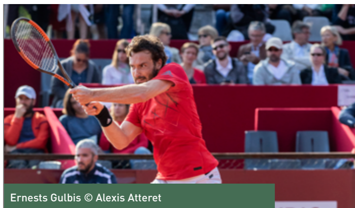
Ernests Gulbis