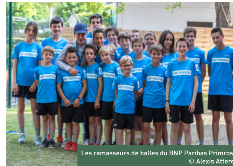
Les ramasseurs de balles du BNP Paribas Primrose

Charles : « Il ne faut pas bouger sur le terrain pour ne pas déconcentrer les joueurs en action. Parfois, ils font arrêter le point juste parce qu'un ramasseur a fait un petit mouvement. Il faut que nous restions le plus sérieux possible. »