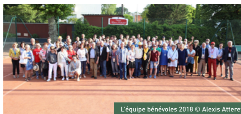
L'équipe bénévoles 2018